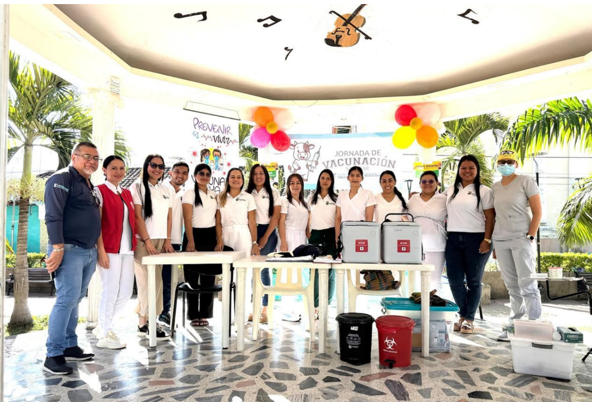
3ra Jornada nacional de vacunación Hospital Nuestra Señora de Belén - IPS Salazar